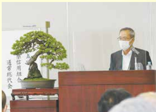
通常総代会の様子