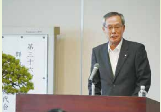
通常総代会の様子