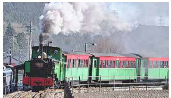
(もくもくと煙を吐きながら園内を周遊するSLあぶとくん)

碓氷峠鉄道文化むらの蒸気機関車「SLあぶとくん」は、1999年の開園当初から来園者に親しまれてきました。老朽化に伴い修繕が必要でしたが、修繕費は1,000万円以上の莫大な費用がかかってしまいます。そこで、修繕費を調達するためクラウドファンディング(CF)を立ち上げ資金を募ったところ、個人・団体から約1,372万円が集まり、令和3年7月に無事修理をすることができました。当組合も同企画を応援させていただきました。