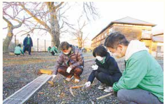
(富岡製糸場内の除草作業)

世界文化遺産・富岡製糸場の美化活動「リレー・フォー・クリーン」に平成25年度から参加し、施設内の清掃活動を行っております。 令和3年度は3回開催され、延べ64名の職員が参加して除草作業などのお手伝いをさせていただきました。