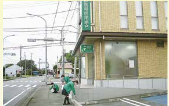
(店舗周辺の清掃活動)

毎月第2水曜日の朝、全店舗の役職員が店舗周辺の清掃を行い、地域の環境美化のお手伝いをさせていただいております。