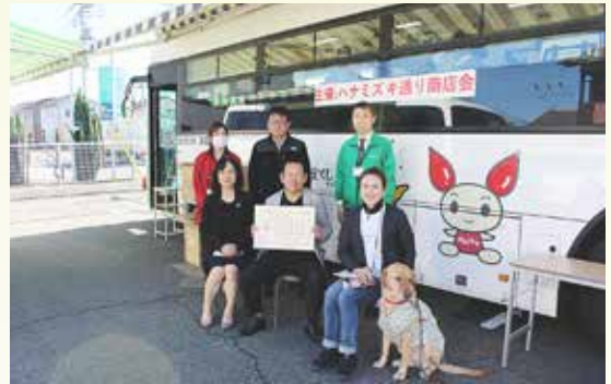
(高崎支店における献血活動)

毎年8月から9月にかけて「しんくみいきいき献血運動」を実施しております。 また、高崎市内の商店街に協賛し、11月に当組合高崎支店を会場とした献血活動を行いました。