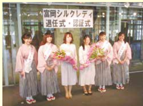
(富岡市シルクレディの退任式・認証式)

地元市町村のキャンペーンレディに当組合の職員が就任し、さまざまなイベントのお手伝いをさせていただいております。令和3年度は、富岡シルクレディの認証式と退任式が富岡製糸場西置繭所多目的ホールで開催され、当組合職員1名が任期満了にともない退任し、当組合職員1名が新たにシルクレディに就任いたしました。任期は2年間で、ラジオやテレビ番組などに出演し、富岡市内の観光や物産などの魅力について発信してまいります。