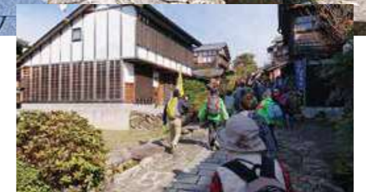
信州 木曾路馬籠宿ウォーク