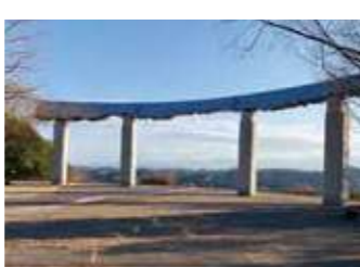
(上)安中榛名駅近くの「みのりが丘パノラマパーク」 (下)天空の丘公園

独占状態の芝生滑り台 みのりが丘パノラマパーク 安中榛名駅から南へ80mのところを整備されている「みのりが丘パノラマパーク」は、西毛地区の山並みが一望できる高台で、地形をいかした上下2段階構成。上下段をつなぐ斜面は芝滑り台になっています。