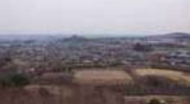
連石山からの眺望

8 楽山園 織田信長の次男信雄(のぶかつ)が7年の歳月と巨費を投じて築いた池泉回遊式庭園。戦国武将庭園から大名庭園への過渡期の庭園としても注目されます。周囲の山なみを借景として取り込み、豊かな広がりを出した庭園美が見事です。