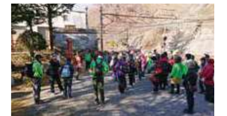
旧碓氷峠アプトの道ウォークに出発