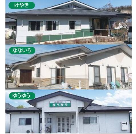
安中市在住等、入居条件あり。お問合せを