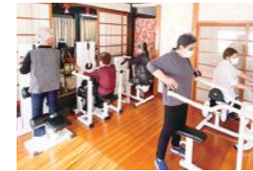
インナーマッスを鍛え、正しい姿勢に導くマシンも使えます

高崎市の「瀬間はり灸接骨院」は2019年に機能訓練や体力向上を目指して、介護予防に取り組むデイサービスを開設。昨年7月、下仁田でも同様のデイサービスをオープンしました。利用者は週に一度、筋力強化と体力向上のためのエクササイズを行います。スタッフの目が行き届くよう、定員10人の少人数制です。グループで運動やストレッチを行い、国家資格者による個別機能訓練も実施し、自立生活の維持を支援。スタッフや利用者との親睦も深まり、地域のコミュニティとしても大きな役割を担います。同施設は下仁田、富岡エリア在住の65歳以上が対象。7月から新たに午前枠を設置し、定員を増やします。