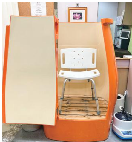
蒸気を利用できるサロンは県内ではごく僅か。一度お試しください