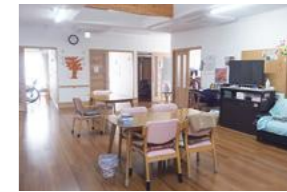
木の温もり漂う、なないろのホール。居心地の良い空間です

安中市内で3ヶ所のグループホームを展開する(株)ティエムコーポレーション。施設は全て個室、少人数での共同生活です。今までの生活環境に近い状態で、尊厳のある生活を保てるよう、介護職員がしっかりとサポートしています。外泊や外出が可能だったコロナ前のように、家族とのかけがえのない時間を徐々に増やす予定です。入居者は地域のお祭りや公民館の催しにも積極的に参加しています。地域行事に参加することで、地域との関わりが深まりました。地元の老人会は同施設の運営推進会議に出席し、施設内の修正箇所などを提案。職員も交えて、常に居心地の良い居場所づくりを心がけています。