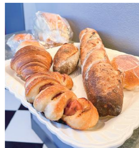
パンの値札にはパンの説明と、おすすめのお酒を表記

豊富な品揃えの「なかざわ酒店」がベーカリーをオープン。お酒と楽しめる、噛み応えのあるハード系のパンが並びます。たっぷりのゴルゴンゾーラとくるみを包み、焼き上がり後に蜂蜜を染み込ませた「ゴルゴンゾーラとくるみのフランス」は、甘さと香ばしさと塩加減が絶妙のバランスです。少し辛口の「カレーパン」は油で揚げず、オーブンでカリッと焼き上げました。フランス産の小麦、塩、硬水を使い、低温長時間発酵で仕上げた「バゲット」も絶品。ガリガリッと噛むほどに豊かな香り、旨み、甘みが広がります。ハード系だけではなく、あんぱん、メロンパン、クリームパンなども並び、幅広い年代層が来店。人気上昇中です。