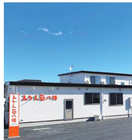
25床の老人ホーム。見学は随時受け付けています

生涯の住まいとなる同施設で、楽しく過ごしてほしいと、季節ごとに様々なイベントを企画します。いちご狩り、乗附緑地の散策、近所の小学校への花見、向かいの保育園の運動会の応援など、趣向を凝らしたイベントは大好評。笑顔で溢れます。入居者の身体機能が低下した時は、ケアマネを含めた経験豊富な職員が話し合い、安全に快適に過ごせるプランを提案。本人や家族の理解を得ながら、次の段階へシフトします。「目の前の人を大切にする」との企業理念のもと、職員は入居者が笑顔になれるよう、温かい気持ちで寄り添い、心を込めてケアに励む一方で、働きやすい環境づくりにも取り組んでいます。