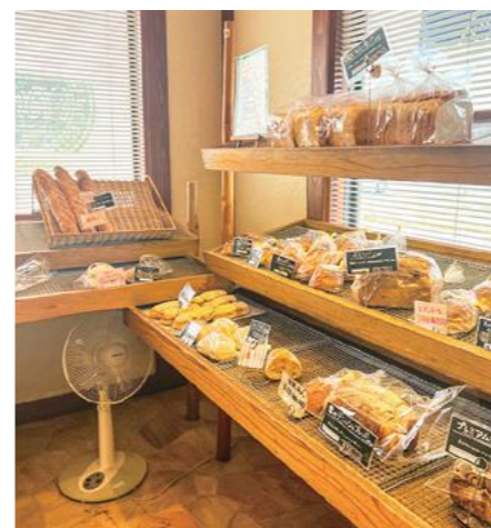
ここでしか味わえないパンを、真心込めて作っています