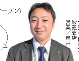
一の宮南野井 妙義支店 営業/鳥井

認知症対応型 共同生活介護 安中市中宿 ・けやき グループホーム ・なないろ ・ゆうゆう