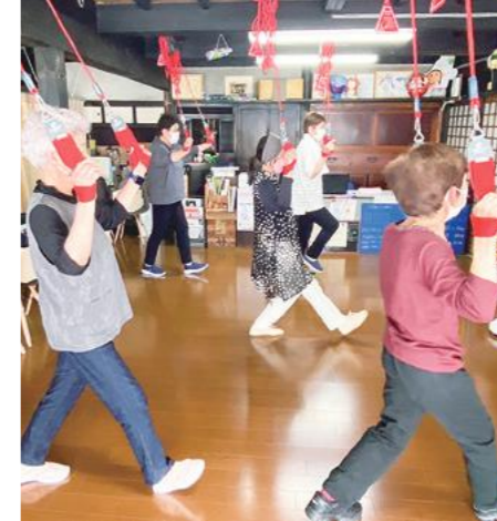
音楽に合わせて楽しく運動できるレッドコードトレーニング