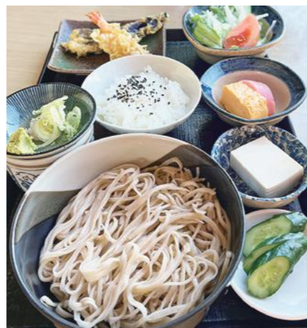
天ぷら、小ライス、サラダなどが味わえる「そばセット」(900円)

創業26年目の蕎麦店。風味と喉越しが良い手打ち蕎麦と手打ちうどん。カツオ、アゴ、コンブ、シイタケから取る出汁で作るつゆを求めて、リピーターが訪れます。「肉体労働の職人さんに、一品で満腹になってほしい」と、お客さま思いの優しいご主人が作る料理は、ボリュームがあってリーズナブルです。夏におすすめのメニューは、天かす、きゅうり、トマト、山菜をたっぷり乗せた「冷やしたぬき」(750円)。暑い季節でも、さっぱりと楽しめます。カツ重や親子丼などのご飯物に200円をプラスすれば、麺付きのセットに。ご飯と麺の両方を楽しみたい欲張りさんに、ぴったりです。