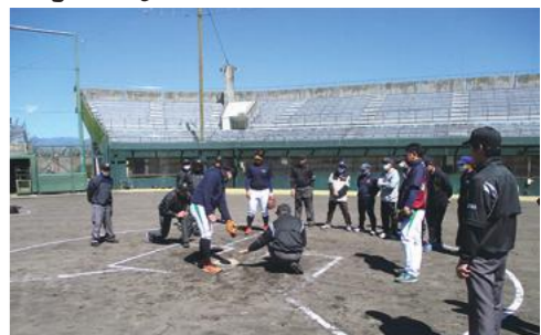
当組合野球部が参加し講習している様子