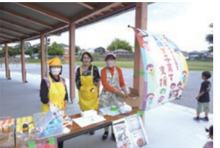
あんなかスマイルパークで開催された子ども食堂

よる寄付金16万円を贈呈しました。寄付金は、食材購入等運営費用に活用して頂きました。「安中市子ども食堂連絡協議会」は、安中市内9カ所の子どもの食堂と連携を図るため2019年にスタート。1学区に一つの子ども食堂を目指し、老若男女を問わずさまざまな人が自由にそして心地良くいられる居場所を創るため継続した活動を行っています。