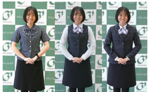
(左)半袖のオーバーブラウス (中央)白のブラウスとベスト (右)ベストと同じ素材・色のジャケットを着用

令和5年4月から女子職員の制服が新しくなりました。今まで通り当組合の職員であるというイメージと、働きやすさや仕事に対する責任感や誇りを自覚できるデザインです。