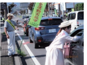
富岡シルクレディ

7月11日には、「夏の県民交通安全運動」の一斉指導で、富岡市しんくみピーターパンカードののめ跨線橋南交差点や松井田信号付近でドライバーに配布物を配り、安全運転を呼びかけました。 これからは、ラジオやテレビ番組などに出演し、安中市や富岡市内の観光や物産などの魅力について発信していきます。