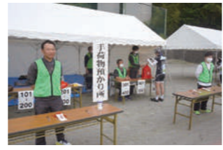
スタート前の手荷物預かり所

いつもは自転車ですピードを競うレースですが、スピードを制限された街中はゆっくりと景色を楽しんでいる様子でした。県内外から461名が参加。日本三大奇勝の1つ妙義山や市内の名所を巡りながら約61kmを走り抜けました。当組合からは、職員14名が大会のお手伝いをしました。