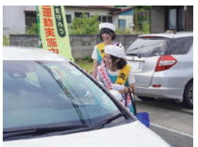
安中観光キャンペーンレディ

富岡市では「富岡シルクレディ」が富岡市観光協会や関連団体が主催する行事やイベントに参加し、富岡市の観光イメージを高め、事業の推進に頑張っています。 令和5年6月10日、富岡シルクレディの認証式・退任式が富岡市社会教育館で開催され、当組合職員1名が昨年に続きシルクレディに就任しました。 また、安中市でも、6月11日に、令和5年度「安中観光キャンペーンレディ」の委嘱式が安中市役所松井田庁舎で開催され、当組合職員1名が安中観光キャンペーンレディに就任しました。